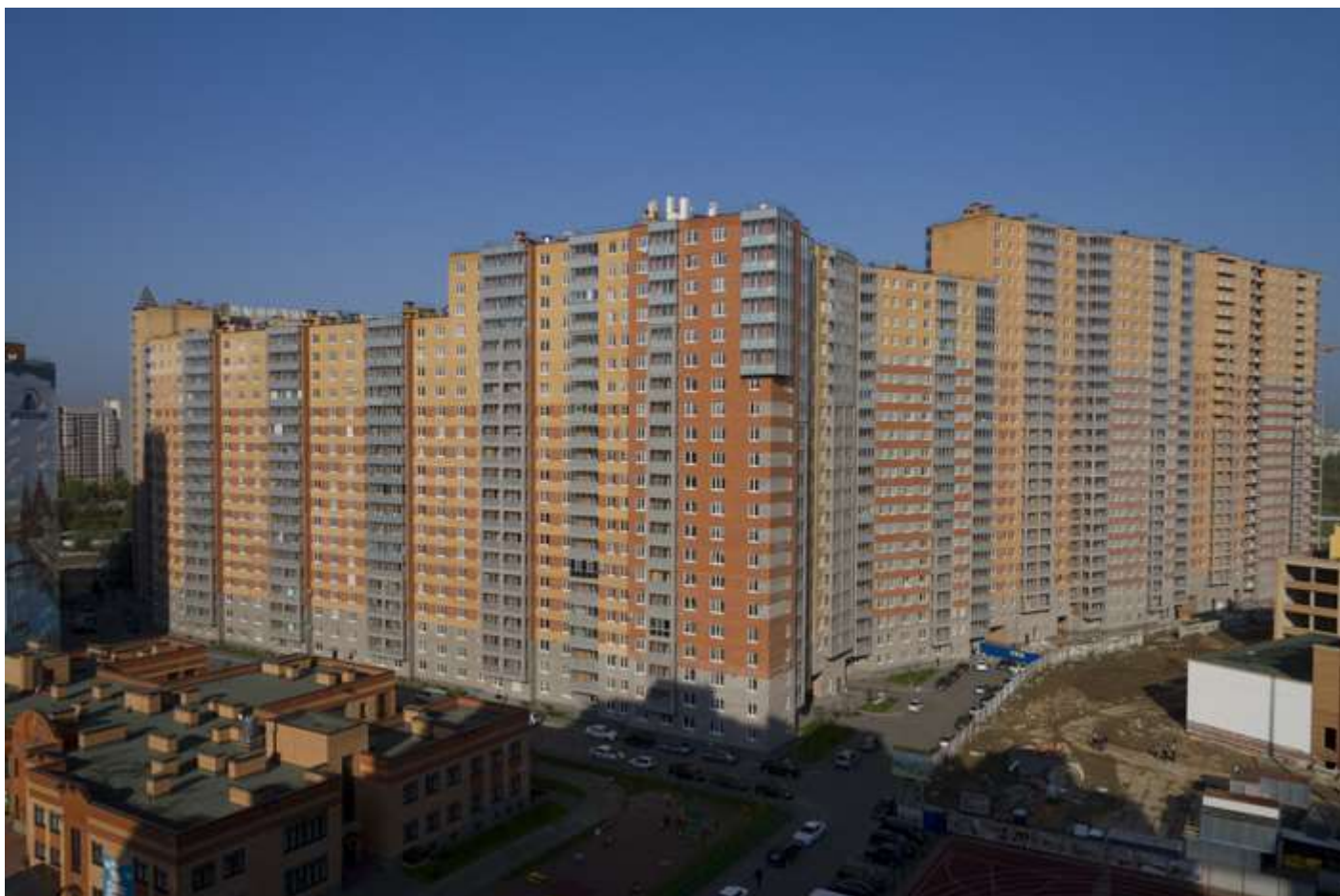
Вид со стороны детского сада на секции 12-4, 35-29