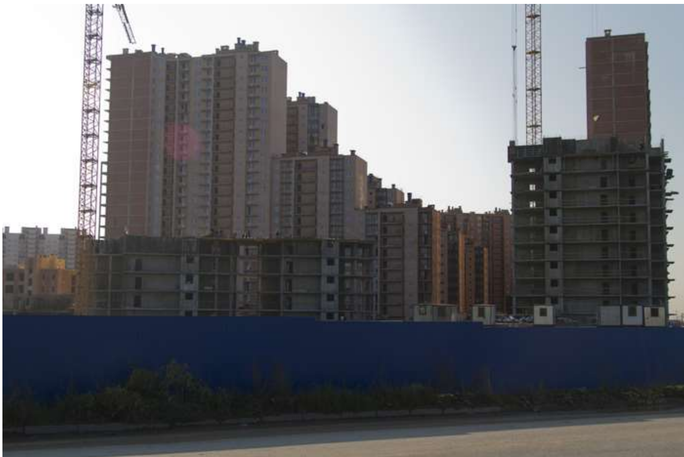
Вид с Областной ул., секции 22-21, 18-19