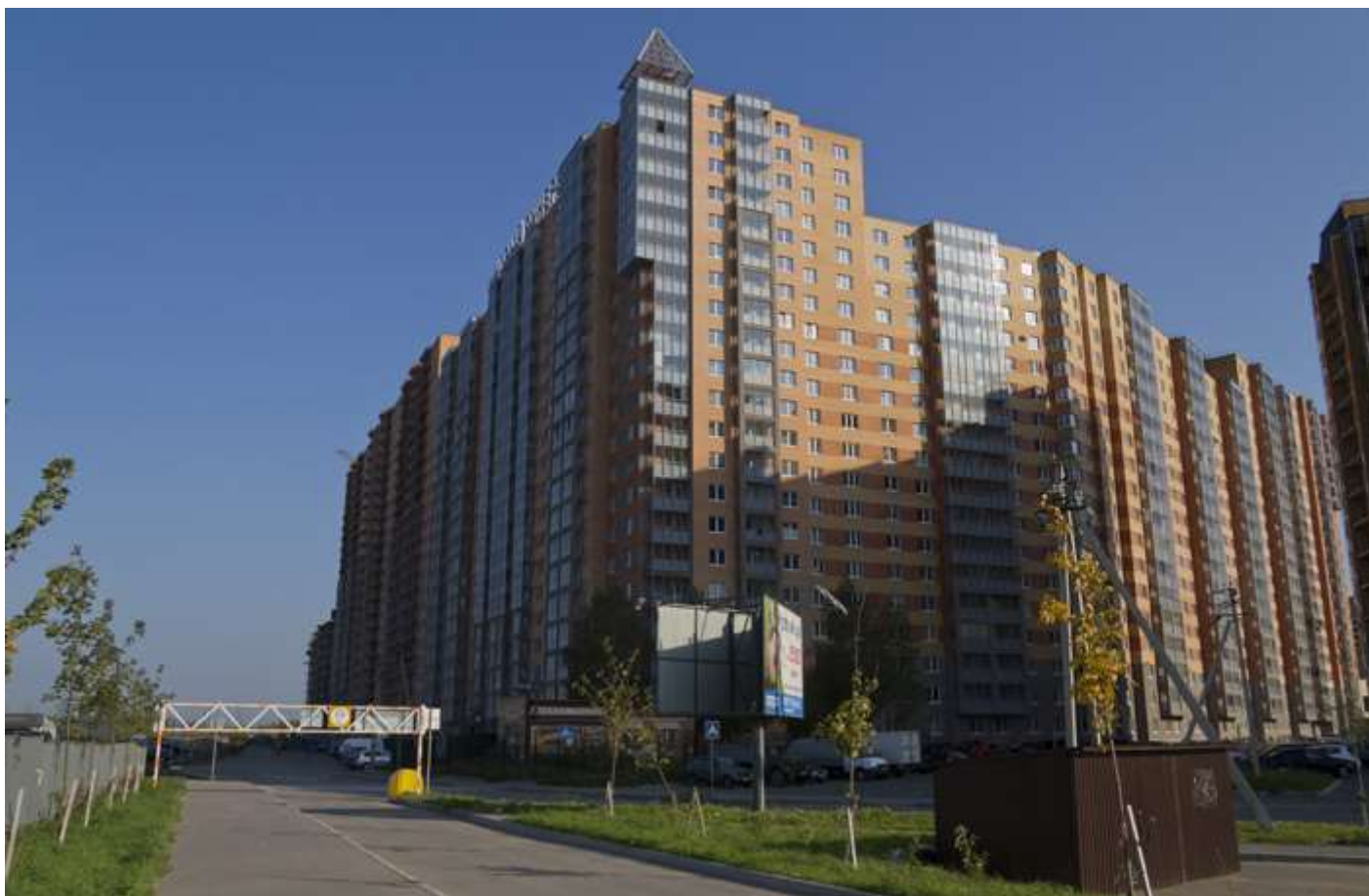
Вид с Областной улицы на секции (слева направо) 17-7