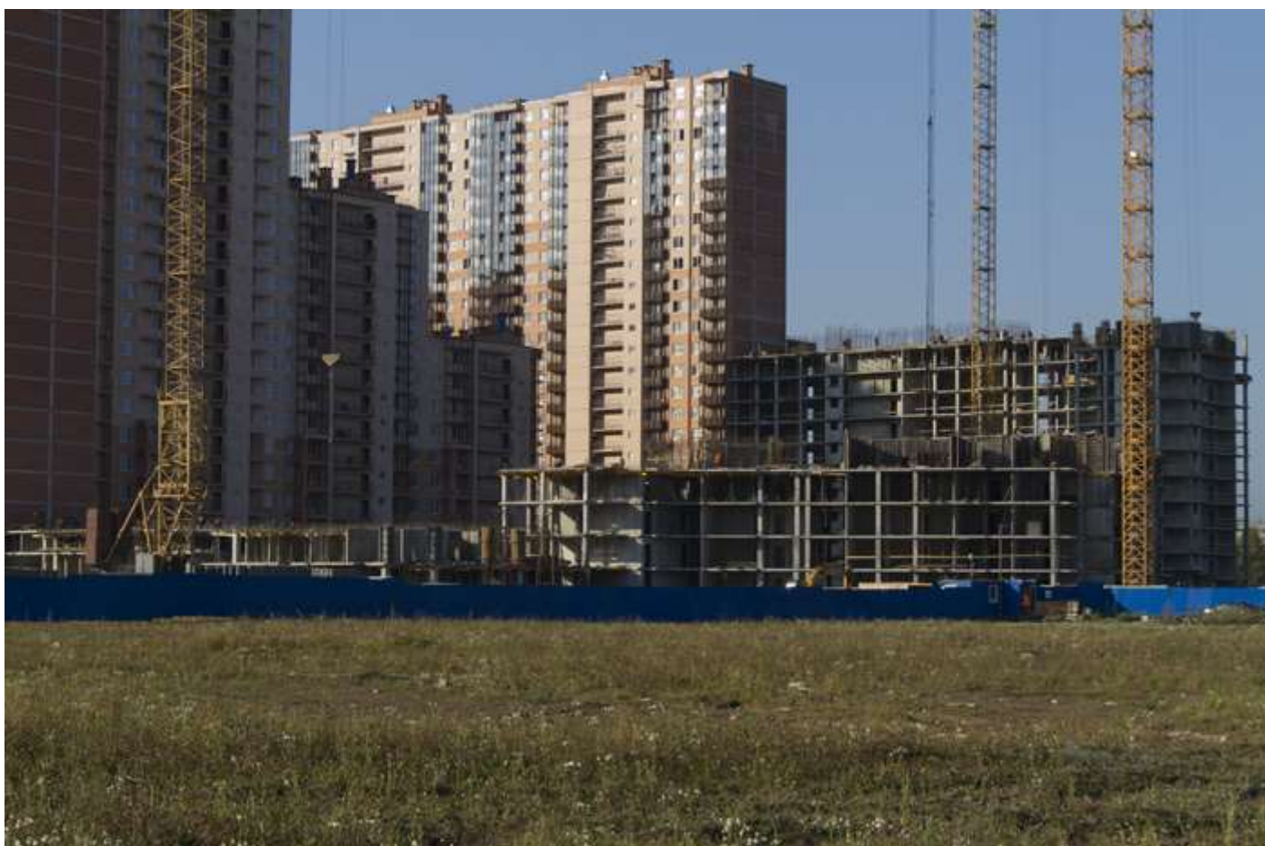
Вид с Областной ул. на секции 25-22, 18-19