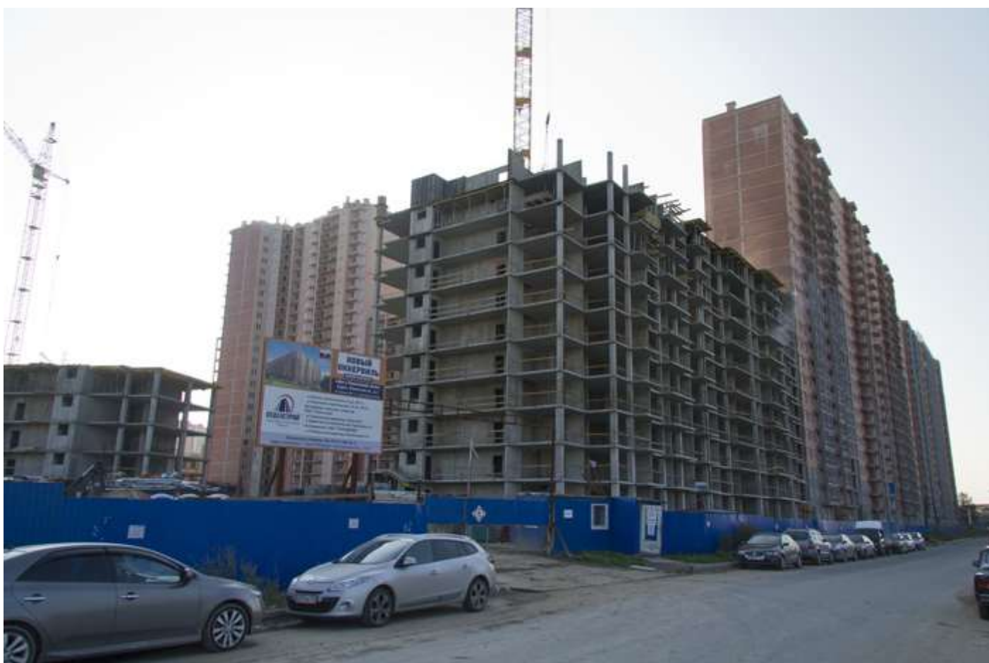
Вид с Областной ул. на секции 21, 19-18