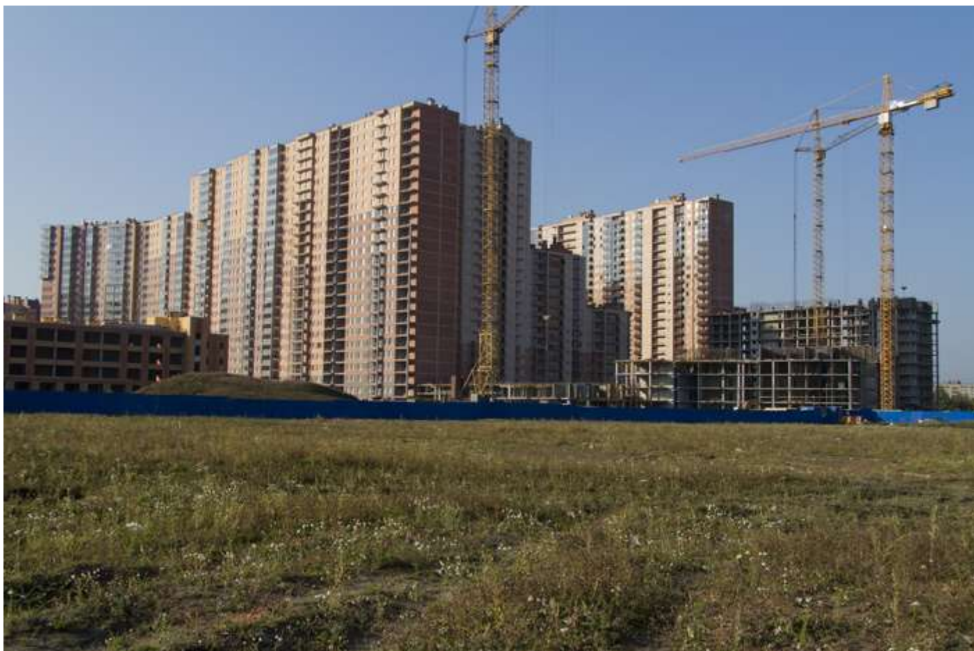
Вид со стороны Областной ул., секции 6-4, 35-34, 30-26, 25-22, 16-17, 18-19