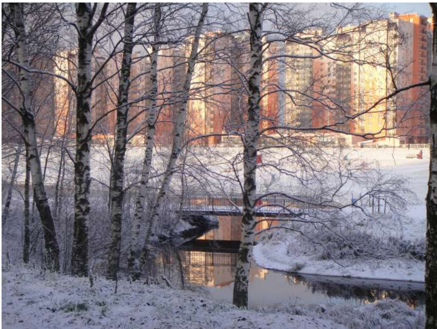
Во дворе - действующий детский сад с начальной школой